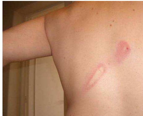
Blessures subies par Philippe.

Le 9 mai 2007 dans la soirée, Philippe 38 a été interpellé pour un contrôle d'identité en compagnie de plusieurs autres personnes à la suite d'une manifestation pacifique dans le VI e arrondissement de Paris. Tous ont été conduits en fourgon au commissariat de police de la rue de Clignancourt (XVIII e arrondissement). Arrivés à destination, a indiqué Philippe, ils ont été maintenus plusieurs heures dans le car de police fermé hermétiquement. Il faisait une chaleur étouffante, il n'y avait aucune aération et ils se sont heurtés à des refus quand ils ont demandé de l'air et de l'eau. Selon Philippe, il y a eu également un jet de gaz lacrymogène à l'intérieur du véhicule.