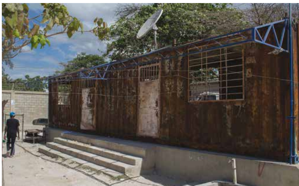
© Bureau des services haïtiens de l'immigration à Anses-à-Pitres, avril 2016. Le bâtiment, visé par un incendie volontaire début 2016, n'a pas été remis en état. Le représentant des services était assis dans la rue quand Amnesty International s'est rendue à Anse-à-Pitres. ©AmnestyInternational

Certains des témoignages ci-dessus révèlent également que les autorités dominicaines n'ont pas pleinement respecté le Protocole d'accord sur les mécanismes de rapatriement conclu entre les gouvernements dominicains et haïtiens en décembre 1999. Ce texte prévoyait plusieurs garanties, la République dominicaine s'engageant notamment à ne pas expulser de migrants la nuit ou via des postes-frontières informels ; à éviter de séparer les familles nucléaires ; à autoriser les personnes expulsées à récupérer leurs affaires et à conserver leurs papiers d'identité ; à remettre un exemplaire de son avis d'expulsion à chaque personne expulsée ; et à informer au préalable les autorités haïtiennes des opérations d'expulsion.