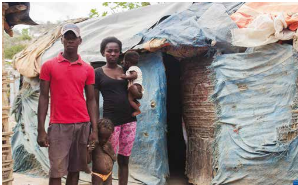
© Fefe Jean et sa famille, Parc Cadeau 1, avril 2016. ©AmnestyInternational

qui ne se sont pas inscrites dans le cadre du programme de naturalisation prévu par la loi 169-14 65 .