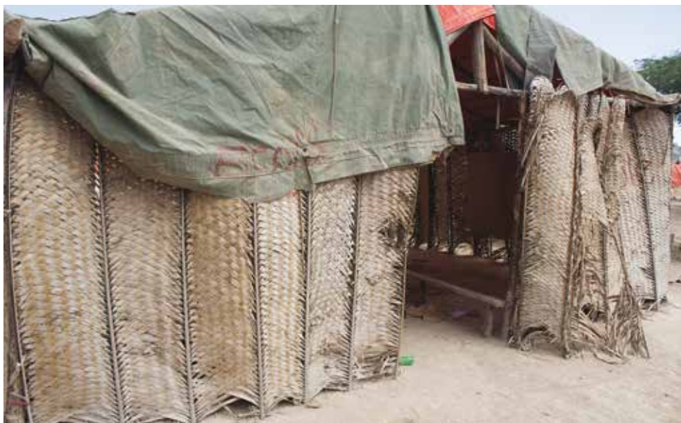
© Une école à Parc Cadeau 1. Parc Cadeau 1, 2016. ©AmnestyInternational

« Mon fils est mort en novembre à la suite d'une forte fièvre. Je n'avais pas d'argent pour l'amener à l'hôpital. Il n'avait que neuf ans. »