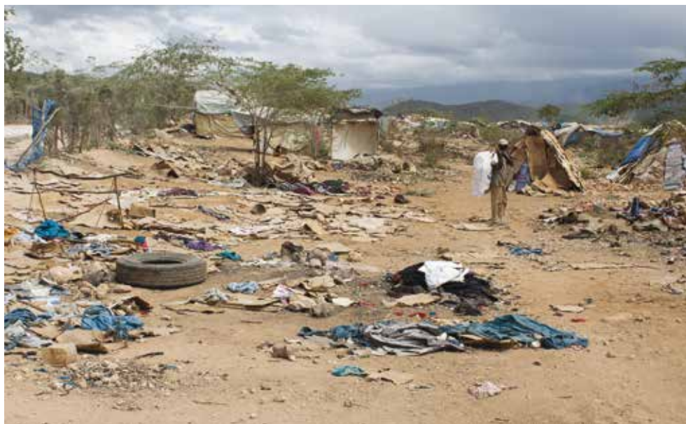
Des résidents détruisent leurs tentes avant d'être relocalisés. Parc Cadeau 2, avril 2016.

On peut certes comprendre ces considérations, mais Amnesty International juge essentiel de compléter le plan de relocalisation avec des interventions plus durables, aussi bien pour les familles relogées que pour les localités qui les accueillent 28 . Au moment de la rédaction de ce rapport, les autorités haïtiennes et des organisations nationales et internationales d'aide au développement et d'aide humanitaire réfléchissaient sur des mécanismes spécifiques pour améliorer l'approvisionnement en eau et l'accès aux services de santé et à l'éducation des familles relogées et des communautés qui les accueillent. Toutefois, ces initiatives risquaient d'être entravées par l'insuffisance des moyens de financement et le peu de motivation affichée par les prestataires de services locaux. Très rares étaient les organisations humanitaires qui avaient proposé des programmes visant à assurer des moyens de subsistance durable pour les familles relogées 29 .