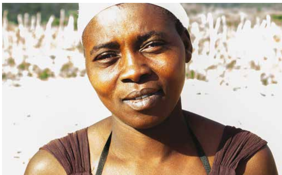
© Nini, Parc Cadeau 1, avril 2016. ©AmnestyInternational

chauffeur et, le soir, j'étudiais. Ils m'ont expulsé pour la première fois en janvier 2015, ils m'ont arrêté alors que je sortais de l'école. Je suis revenu et ils m'ont de nouveau arrêté le 23 juin. Les deux fois, des agents m'ont demandé de présenter des papiers dominicains. Je ne les avais pas, alors ils m'ont conduit au fort militaire. J'y ai passé la nuit puis, quand d'autres personnes sont arrivées, ils nous ont emmenés en Haïti. La première fois, à Jimaní, ils nous ont dit : "Marchez, Haïti est là-bas !" »