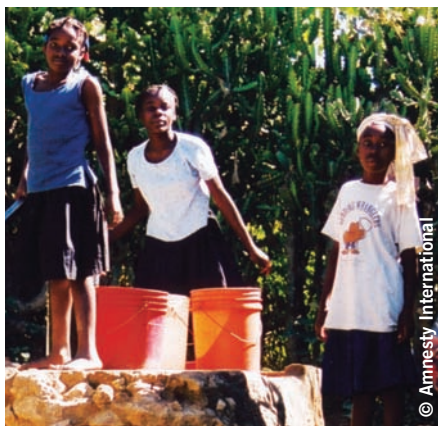
Tifi kap pran dlo nan Depatman Dinò, Ayiti 2004.

Gouvènman ayisyen an, ak sipò kominote entènasyonal la, fèt pou ranfòse ak ijans mezi pou pwoteje tifi kap fè travay domestik epi fè plis efò pou kwape pratik sa toutbonvne.