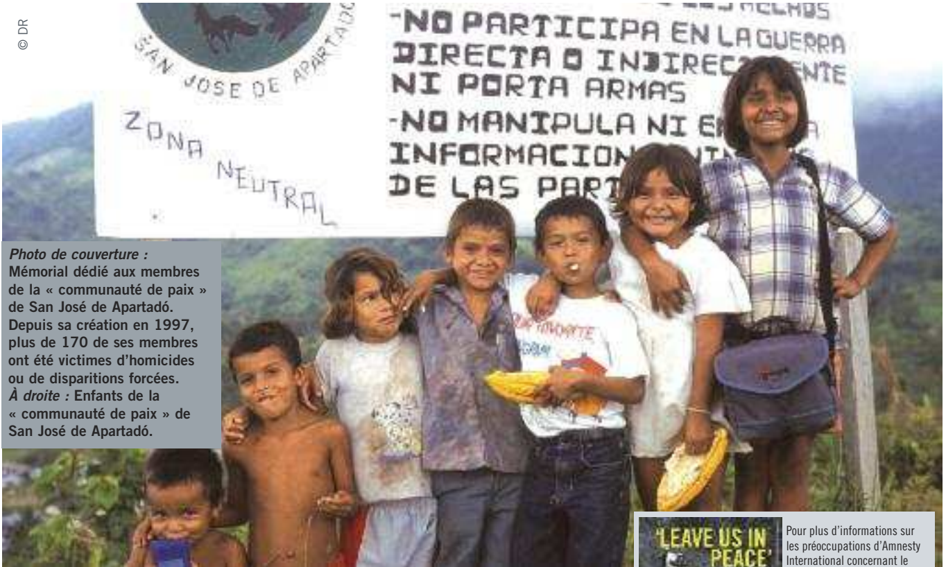
Photo de couverture : Mémorial dédié aux membres de la « communauté de paix » de San José de Apartadó. Depuis sa création en 1997, plus de 170 de ses membres ont été victimes d'homicides ou de disparitions forcées. À droite : Enfants de la « communauté de paix » de San José de Apartadó.