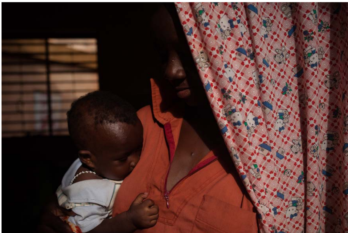
Un centre d'accueil à Ouagadougou offre un refuge aux survivantes de viol, de mariages forcés et précoces et de grossesses non désirées.

l'information, aux services et aux produits relatifs aux soins de santé sexuelle et reproductive, notamment les produits contraceptifs essentiels.