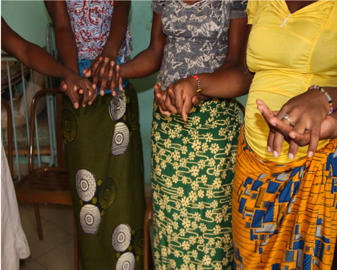
De jeunes filles se tiennent par la main dans un centre d'accueil géré par des religieuses, Ouagadougou, Juillet 2014.