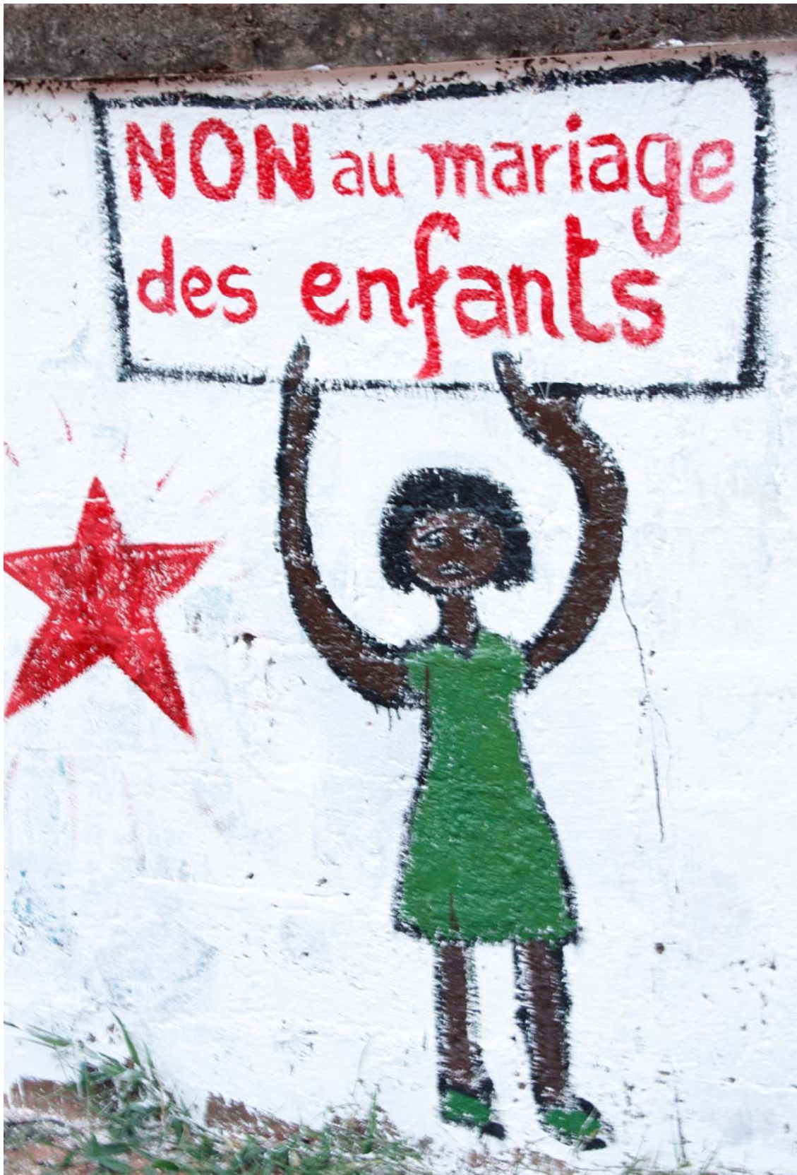
Peinture sur un mur en face de l'association Maia qui travaille sur les droits sexuels et reproductifs, Bobo-Dioulasso, Burkina Faso