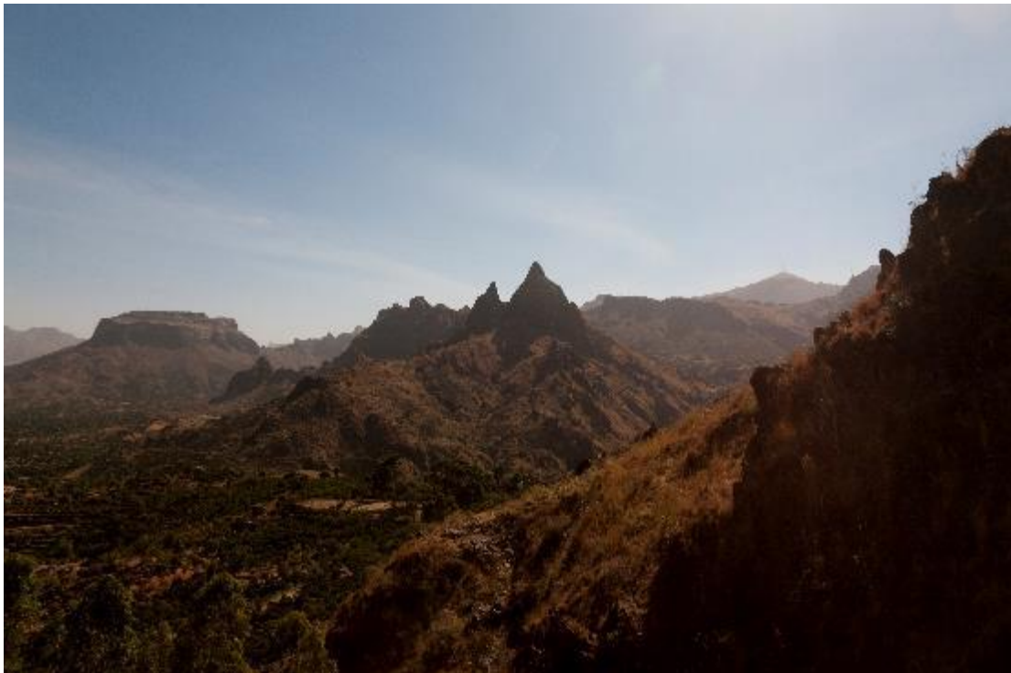
Les montagnes du Djebel Marra près de Dursa, dans le centre du Darfour (Soudan), mars 2015.