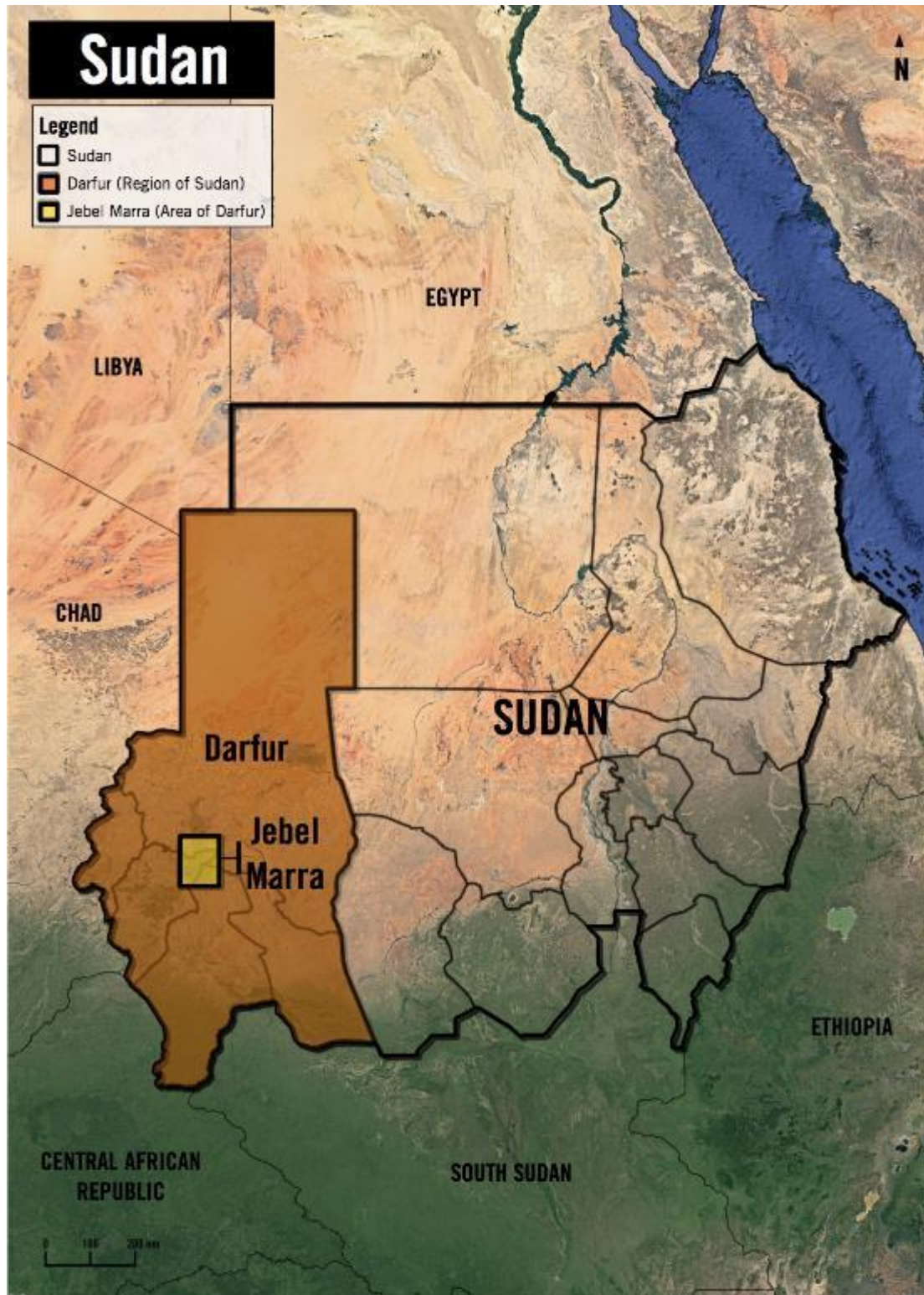
© Google Earth 2016, GADM 2015