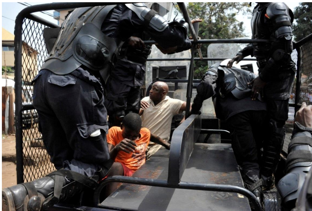
Image 4. Deux manifestants sont arrêtés par des policiers en équipement anti-émeutes, Conakry, 14 avril 2015.

Le Code pénal guinéen puni d'un emprisonnement de deux mois à trois ans toute personne qui n'aurait pas quitté un attroupement après sommation par l'autorité compétente. Cette peine s'ajoute à une possible privation d'un à cinq ans des autres droits civiques, notamment le droit de vote, le droit d'éligibilité ou le droit d'occuper un emploi administratif 34 .