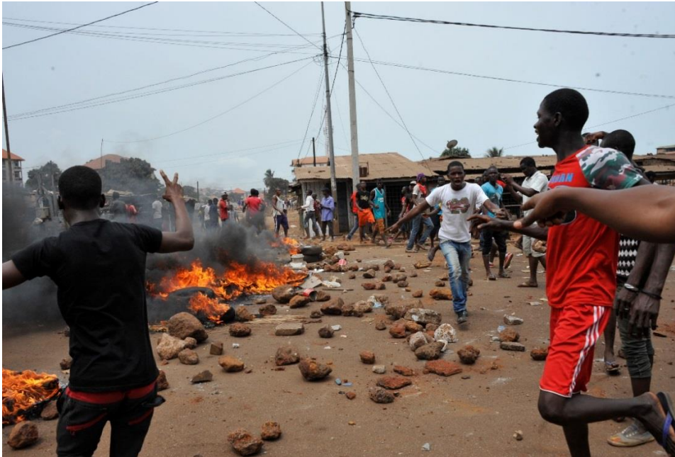
Image 1. Des manifestants posent des pierres et mettent feu à des pneus pour barrer la route à Bomboli, Conakry, le 13 avril 2015.

Ce scénario concorde avec les informations que des policiers ont transmises à Amnesty International sur leurs opérations de maintien de l'ordre en avril et mai 2015. Selon eux, les autorités considèrent que ces manifestations étaient « non autorisées 8 » puisqu'elles n'en avaient pas été notifiées. Lorsque des groupes d'opposition lancent des appels à manifester dans les médias, la police déploie des agents des forces de l'ordre et des équipements anti-émeutes sur les lieux habituels de manifestation pour empêcher tout rassemblement non autorisé. Ils interpellent les manifestants pour les disperser et poursuivent et arrêtent ceux qui commettent des infractions. Les policiers ont admis que la force peut être utilisée à tout moment. Même une fois le rassemblement dispersé, les policiers peuvent continuer à poursuivre des manifestants, en travaillant en collaboration avec des patrouilles mobiles pour les pourchasser dans leur quartier et leur maison.