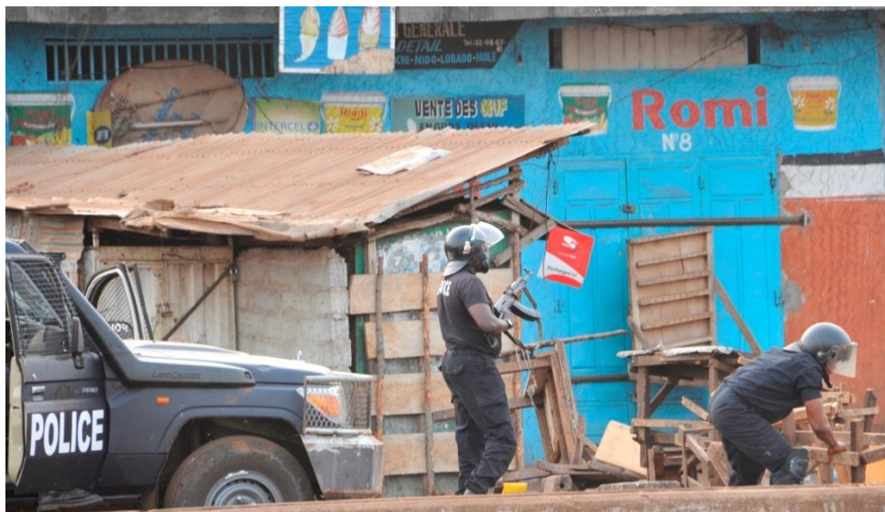
Image 2. Un policier muni d'une arme à feu lors d'une manifestation à Ratoma, Conakry, le 13 avril 2015.

Les récits de la police et des manifestants diffèrent sur la question de savoir qui a eu recours à la force en premier, et ce de quelle façon. Les policiers interrogés par Amnesty International ont déclaré que les forces de sécurité avaient recouru à la force parce que des manifestants avaient ignoré leurs injonctions à se disperser et avaient commencé à jeter des pierres. Ils ont précisé que les forces de sécurité qui participaient aux opérations de maintien de l'ordre n'avaient utilisé que des équipements anti-émeutes, c'est à dire du gaz lacrymogène et des matraques. Ils ont insisté sur le fait que les forces de sécurité n'étaient pas autorisées à porter d'armes à feu, ni à en utiliser, et qu'il était de la responsabilité du commandant des unités déployées de s'assurer que les membres des forces de sécurité sous son autorité respectaient cette règle. Toutefois, les policiers ont également précisé que les patrouilles mobiles, des unités spécialisées comme la brigade anti-crime qui sont parfois appelées en renfort pour pourchasser et arrêter des manifestants, peuvent, elles, porter des armes à feu.