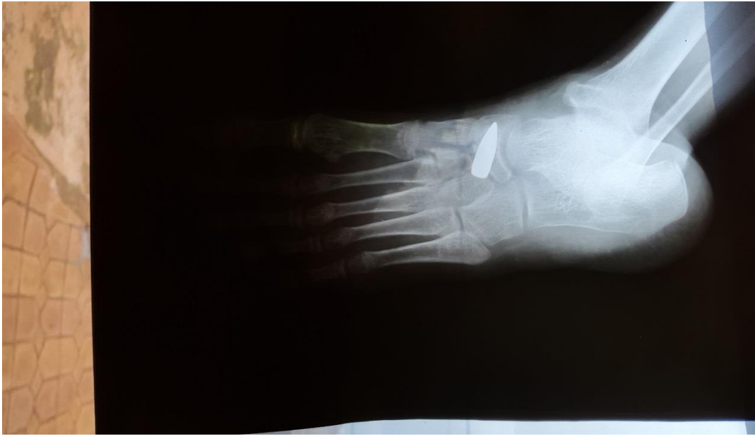
Image 3 : Une radiographie montrant la balle logée dans le pied de Rouguiatou Baldé.