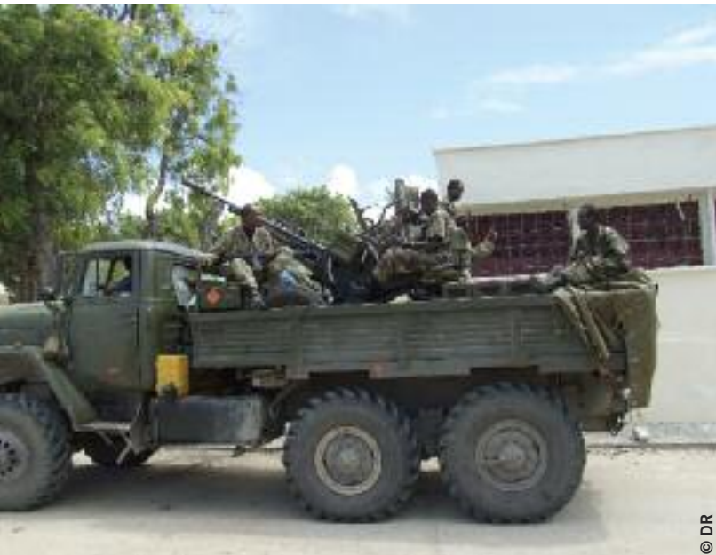
Soldats éthiopiens sur l'un de leurs véhicules militaires à Mogadiscio, mai 2007

« Le 16 octobre 2007, j'étais en Somalie. Un soir, quatre jours après mon arrivée, les Éthiopiens sont venus occuper le village. Ils ont arrêté 41 personnes, dont moi. Ils nous ont emmenés à la base militaire. J'ai pu voir des camions et une bonne quinzaine de véhicules tout terrain [équipés de mitrailleuses]. J'ai été interrogé par un Somalien qui travaillait avec les Éthiopiens. On nous a posé à tous la même question : "Que faites-vous ici ?" Nous avons répondu que nous habitons là.