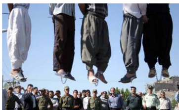
Cinq hommes viennent d'être pendus en public à Mashad (Iran), en août 2007.

Chaque jour, des détenus – des hommes, des femmes et même des enfants – risquent d'être exécutés. Quel que soit le crime commis, qu'ils soient coupables ou innocents, un système judiciaire ayant fait le choix de la vengeance plutôt que de la réinsertion peut leur ôter la vie.