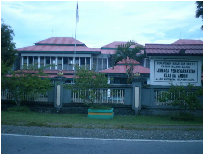
马鲁古省安汶市的纳尼阿监狱

根据当地消息来源，这 14 名囚犯无法得到适当的治疗，明显违反了印尼国家标准 48 和国际标准。《囚犯待遇最低限度标准规则》（第 24 条）和联合国《保护所有遭受任何形式拘留和监禁的人的原则》（第 24 条）要求，必须在囚犯被关押到拘留场所后尽快对他们进行或提供体检。国际标准还要求在必要时对囚犯提供医疗协助（联合国《执法人员行为守则》第 6 条）。