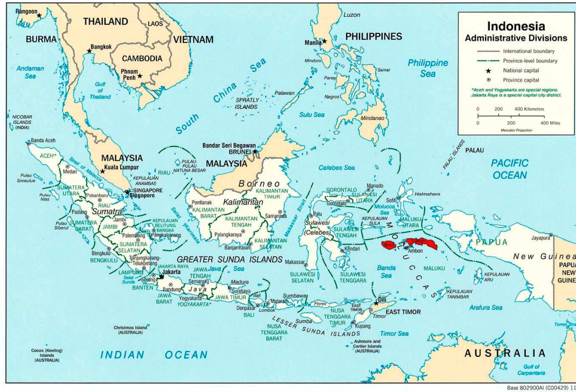
3. 印尼地图