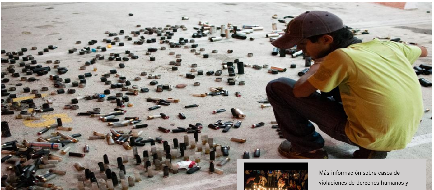
Cartuchos de municiones disparadas en Estado Táchira, marzo 2014