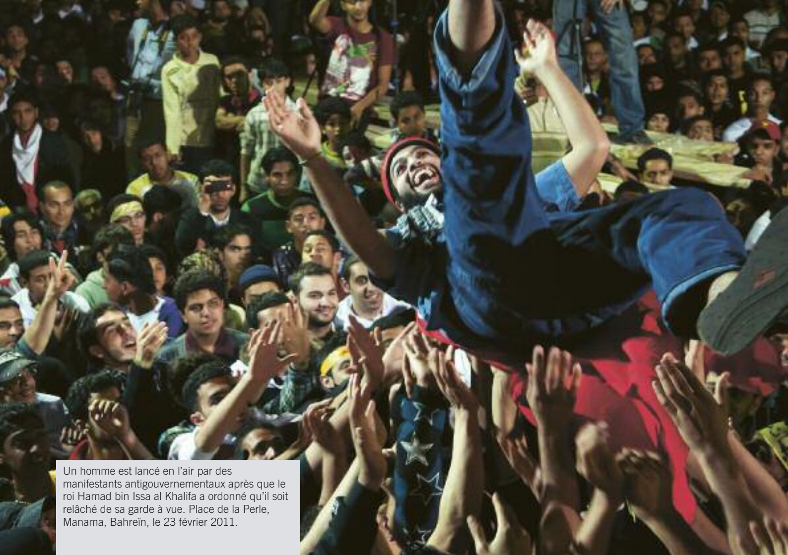
Un homme est lancé en l'air par des manifestants antigouvernementaux après que le roi Hamad bin Issa al Khalifa a ordonné qu'il soit relâché de sa garde à vue. Place de la Perle, Manama, Bahreïn, le 23 février 2011.