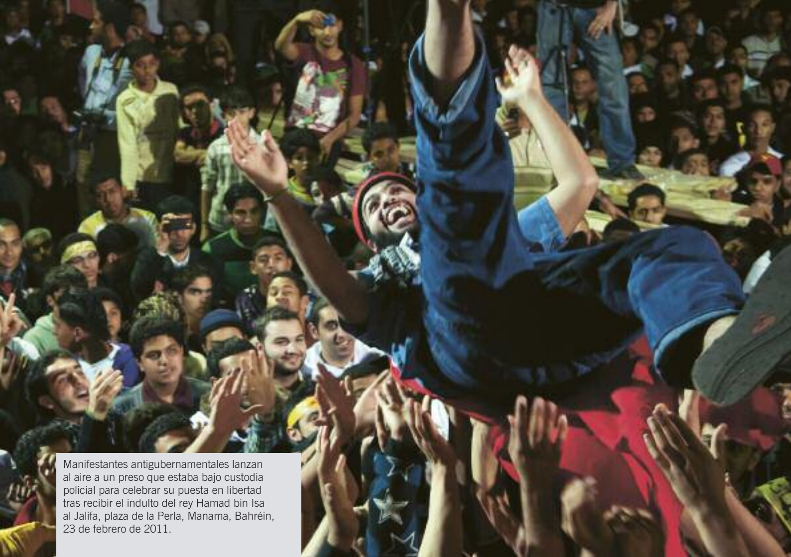
Manifestantes antigubernamentales lanzan al aire a un preso que estaba bajo custodia policial para celebrar su puesta en libertad tras recibir el indulto del rey Hamad bin Isa al Jalifa, plaza de la Perla, Manama, Bahrein, 23 de febrero de 2011.