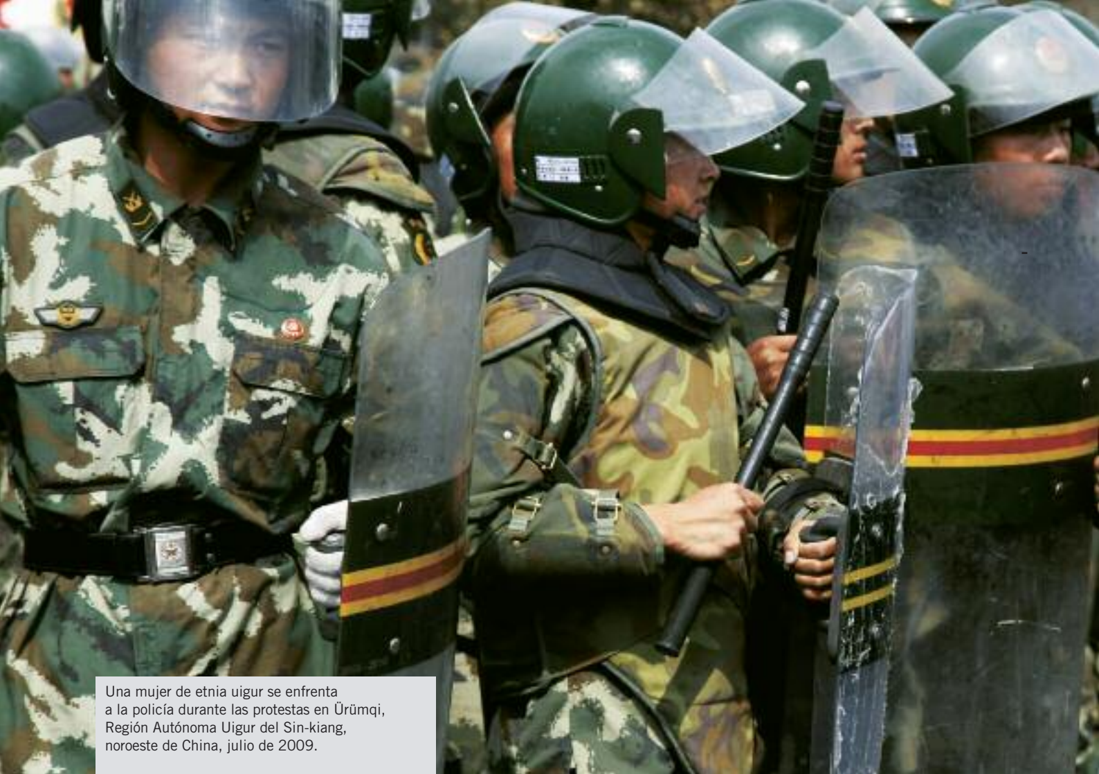
Una mujer de etnia uigur se enfrenta a la policía durante las protestas en Ürümqi, Región Autónoma Uigur del Sin-kiang, noroeste de China, julio de 2009.