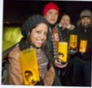
أضواء تسطع على شلالات نياغارا، كندا