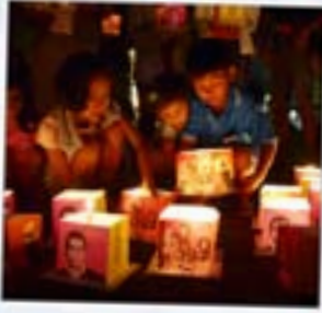
إشعال القناديل في تايلاند

في السنة الماضية، انخرط ناشطون فيما يربو على 80 بلداً في الكتابة من أجل الحقوق - في أعظم فعالية لحقوق الإنسان في العالم.