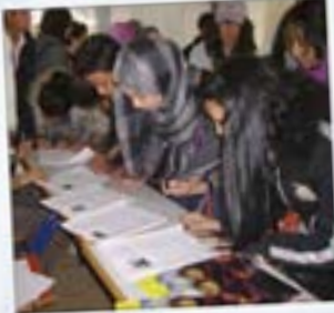
إطلاق الرسائل في المغرب

انضموا إلينا هذه السنة، فبمساعرتكم، سيشتع ضوء هذه الفعاليات بصورة أكثر سطوعاً! واقبلوا الصفحة كي تروا كيف يمكن لكم أن تشاركوا.