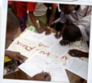
توقيع المناشدات في بوركينافاسو