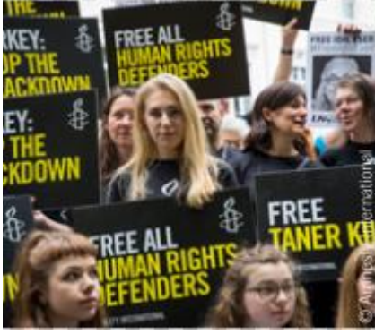
مظاهرة أمام مبنى السفارة التركية في لندن، ١٢ يوليو/ تموز ٢٠١٧.

منظمة العفو الدولية حركة عالمية تضم أكثر من ٧ ملايين شخص بأخذون الظلم على محمل شخصي. ونحن نشن حملات من أجل عالم يتمتع فيه الجميع بحقوق الإنسان.