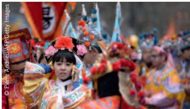
احتفالات السنة الصينية الجديدة في باريس، فرنسا، 2014.