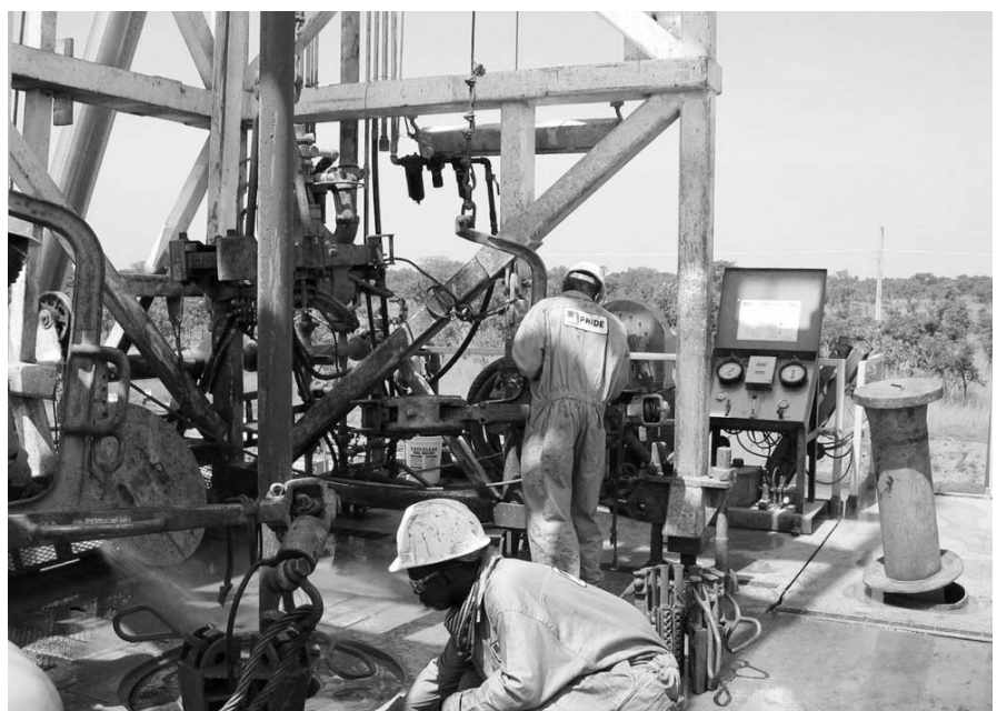
Un puits de pétrole dans les champs de Doba dans le Sud du Tchad.