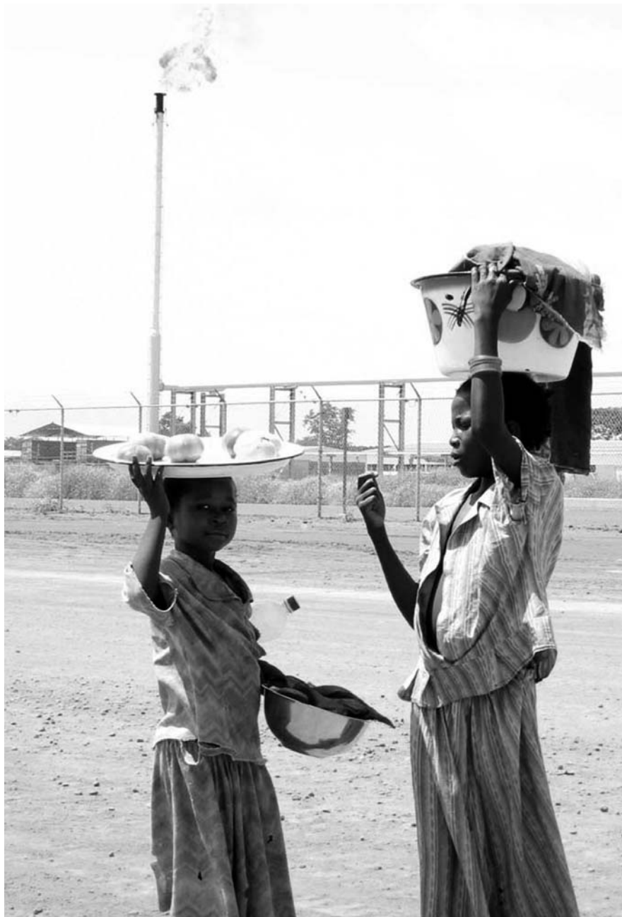
Deux fillettes tchadiennes en face de la station de collecte d'ExxonMobil à Miandoum.

Les contrats devraient être amendés de manière à garantir qu'ils ne puissent pas être invoqués par le Tchad, le Cameroun ou le consortium d'une façon qui fragiliserait la protection des droits humains et tout particulièrement le droit à la santé et les droits des travailleurs.