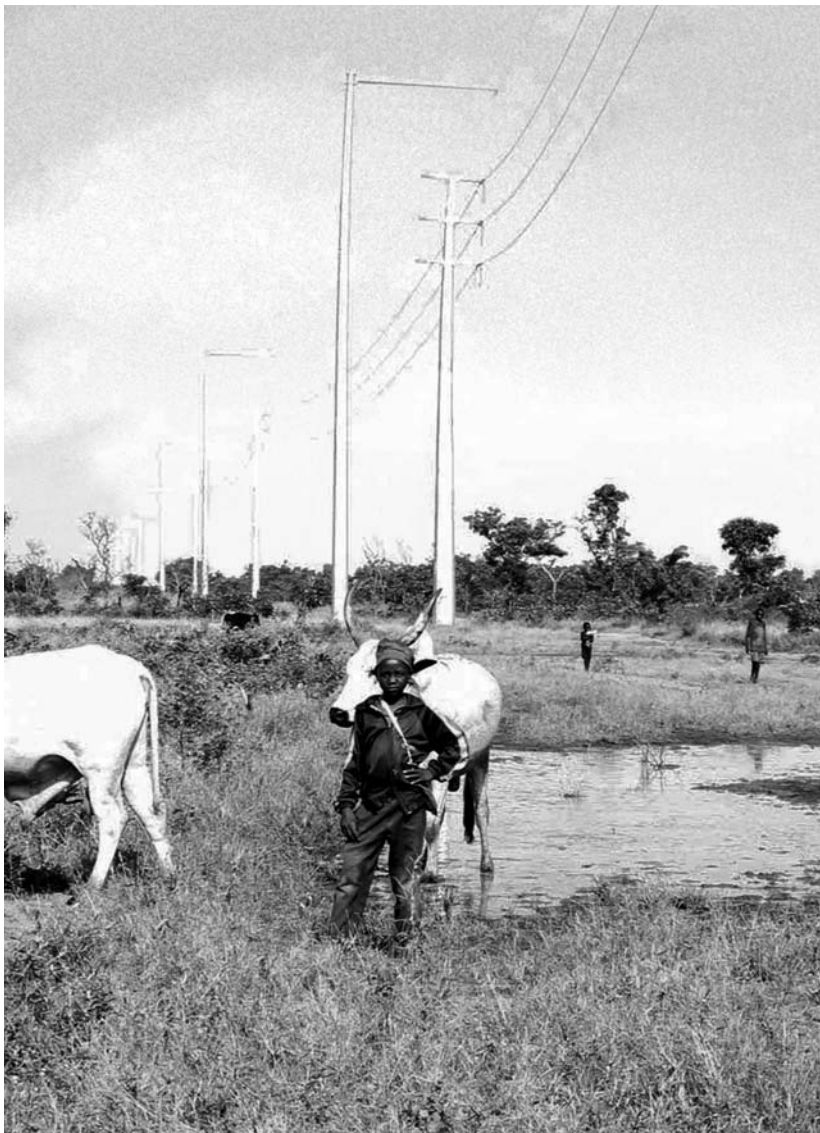
Un troupeau de vaches tchadien sous une ligne électrique de 66 000 kW construite par ExxonMobil pour fournir l'électricité afin de pomper le pétrole des champs du Sud du Tchad.

Le contexte d'arbitrage autorisé par les contrats ne garantit pas que les contrats ne seront pas utilisés pour entraver la réalisation des droits humains. Il pencherait même plutôt en faveur du consortium. Le fait de respecter ces contrats ne doit pas avoir pour conséquence d'entraver les mesures visant à réaliser les droits humains, et les États ne doivent même pas être confrontés à la menace de pénalités pour avoir introduit de telles mesures qu'ils sont obligés de prendre afin de protéger et de mettre en œuvre les droits humains. Les dispositions et contrats relatifs à l'arbitrage devraient être amendés de manière à exclure cette éventualité 113 .