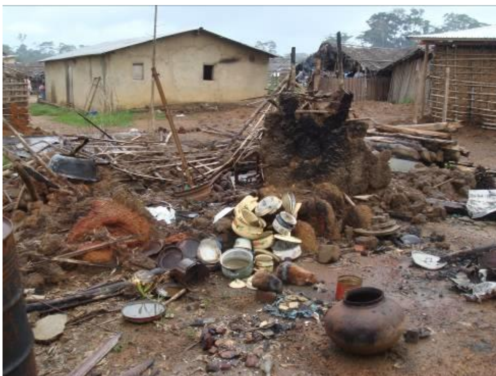
Ruines, dans le village de Gobroko, juin 2011.

Entre le 5 et le 9 mai 2011, cinq villages assez isolés, dans la région de Sassandra, au sud-ouest du pays ont été le théâtre de violations graves du droit international humanitaire et d'atteintes graves aux droits humains. Plus de 200 personnes ont été tuées – dont la plupart étaient des civils non armés. Des dizaines de maisons ont été brûlées et pillées, et au moins un millier de personnes ont été déplacées.