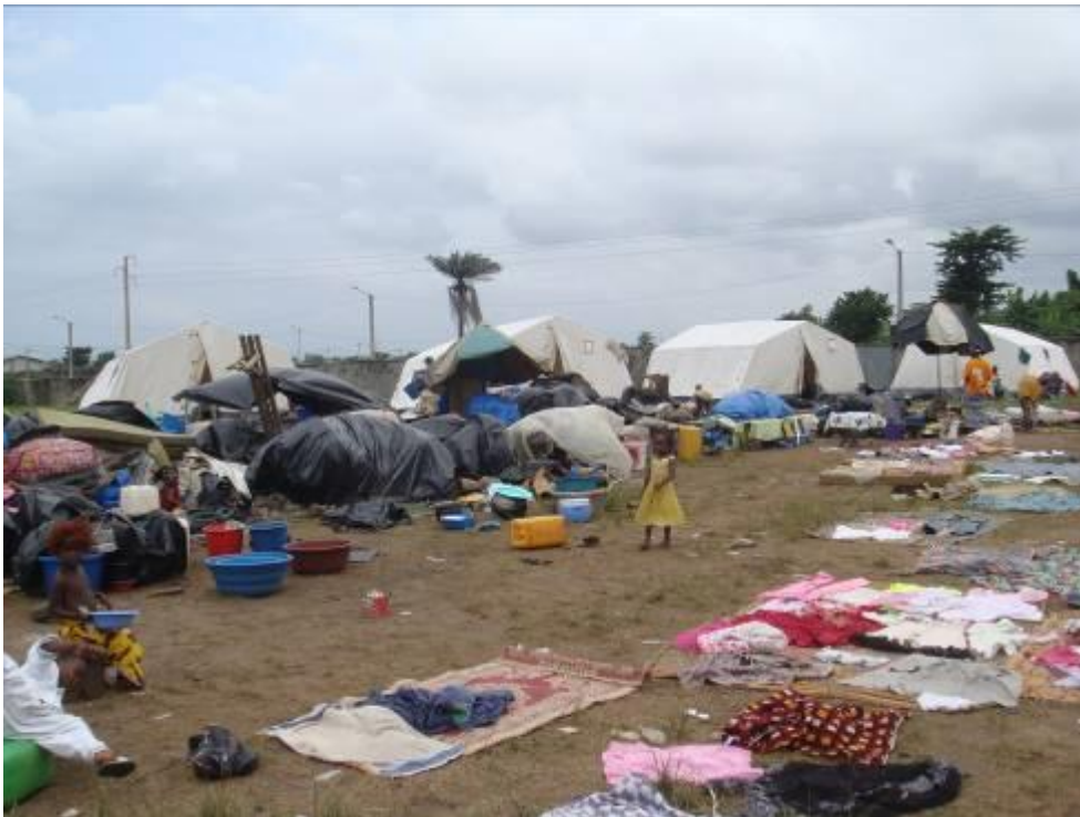
Site de personnes déplacées à l'église catholique Saint Laurent, à Abidjan, juin 2011

De ce fait, le taux de retour des personnes déplacées s'est énormément ralenti et, dans certains lieux, de nouveaux déplacements de populations ont été constatés. Par exemple, le nombre de personnes déplacées vivant au sein de la Mission catholique de Notre Dame de Nazareth à Guiglo est passé de 3 376, au moment du recensement effectué le 10 mai 2011, à 4 000 un mois plus tard 13 . En juin, Amnesty International s'est rendue dans de nombreux villages de l'ouest du pays, situés notamment entre les villes de Guiglo et Bloléquin. Dans ces régions, entre 60 et 75 p. cent de la population « autochtone » guéré – globalement considérés comme favorable à Laurent Gbagbo – n'étaient toujours pas rentrés chez eux. Par exemple, à la date du 11 juin 2011, près de 12 000 personnes vivaient encore au sein de la Mission catholique de Duékoué (à quelque 500 km à l'ouest d'Abidjan). Prenant acte du fait que - pour beaucoup de ces personnes déplacées - la perspective de rentrer chez elles s'éloignait de plus en plus, le HCR a décidé de construire un site officiel sur lequel ces déplacés seraient transférés. À la mi-juillet 2011, deux bâtiments avaient déjà été construits et quelque 800 personnes déplacées avaient été transférées dans ce nouveau site. Lors de sa mission, Amnesty International a également appris que la proportion des retours des réfugiés ivoiriens se trouvant au Liberia avait également beaucoup baissé.