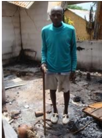
Un homme de 81 ans au milieu des restes de sa maison à Gobroko le 9 mai 2011.