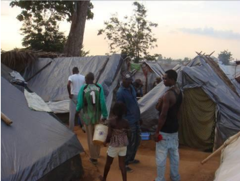
Camp de réfugiés libériens, à Guiglo, juin 2011

« Nous sommes comme des prisonniers dans ce petit camp. Nous ne pouvons ni partir, ni même mettre un pied dehors car nous pouvons être tués à tout moment. Trop de gens détestent les Libériens dans ce pays maintenant. Ils nous disent que nous devrions retourner au Libéria. Mais, pour beaucoup d'entre nous, le Libéria est un pays que nous essayons d'oublier et, pour beaucoup d'autres, c'est un pays inconnu. »