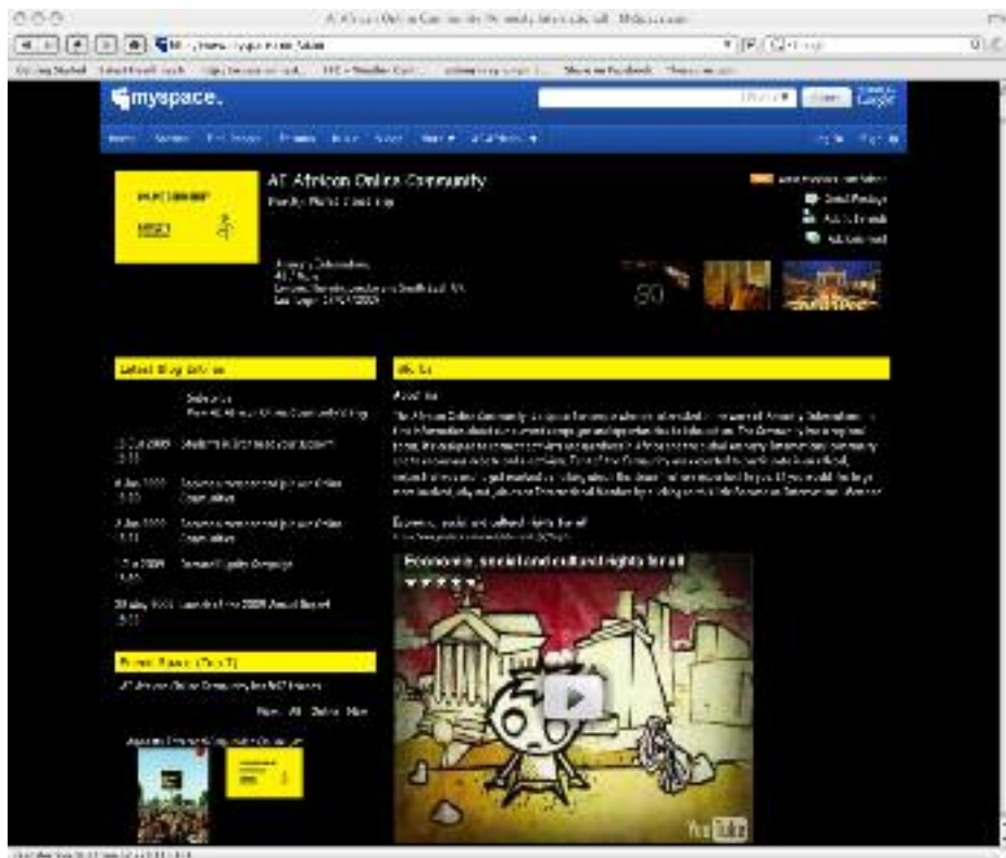
Communauté africaine en ligne sur Myspace