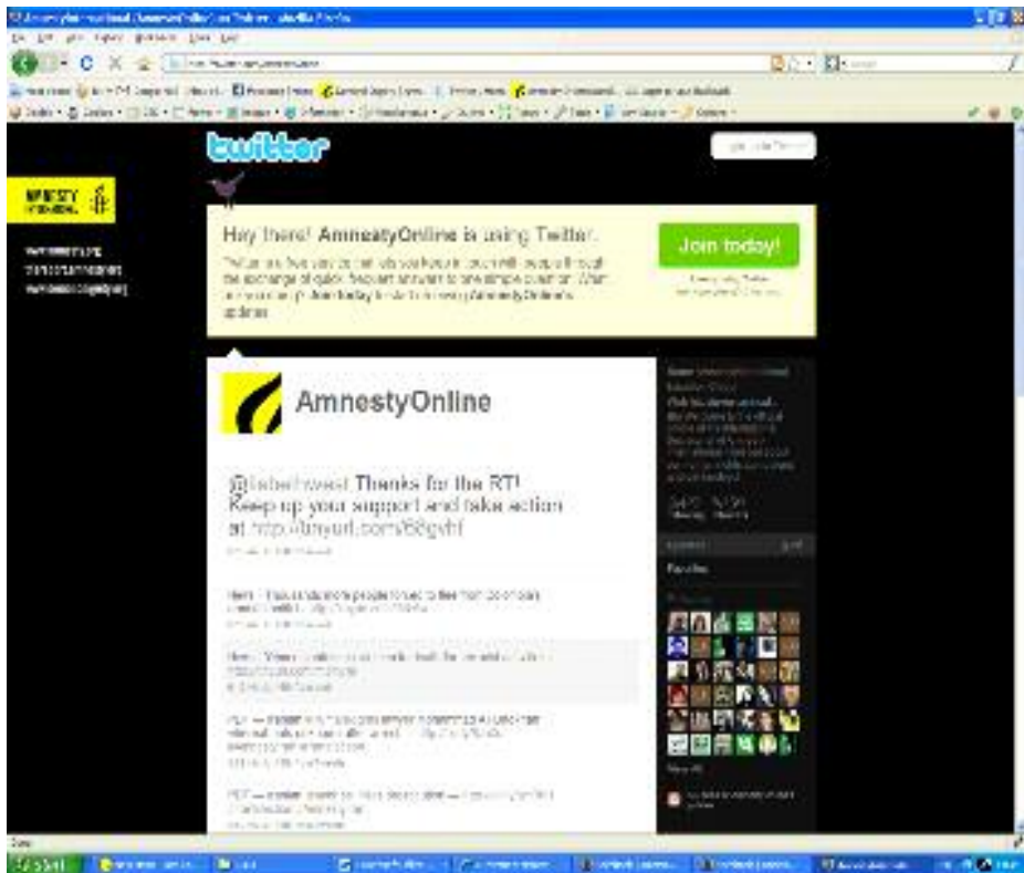
Flux Twitter AmnestyOnline