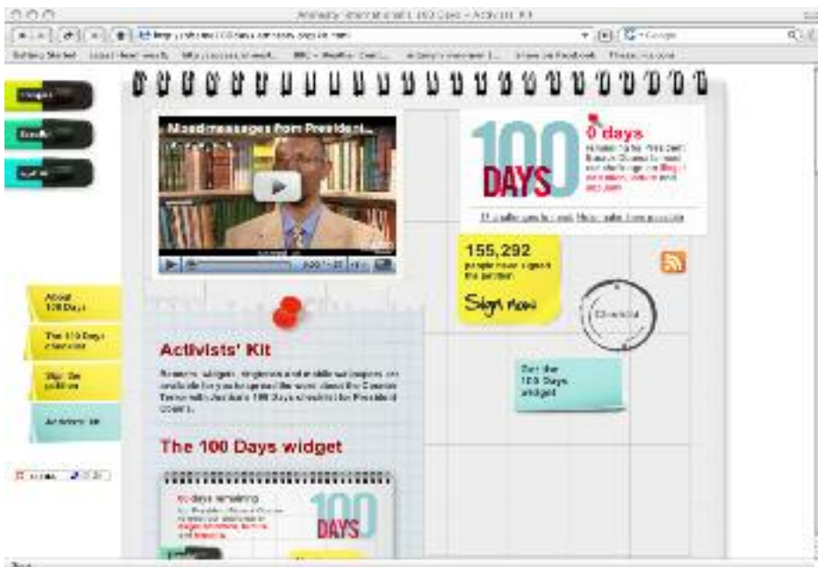
Bandeau « Allumez la flamme » (en haut) et widget pour la campagne des 100 jours d'Obama (ci-dessus).