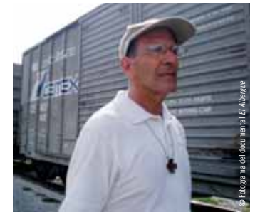
El padre Alejandro Solalinde en una imagen del documental El Albergue , en el que se retratan las historias de los migrantes que llegan al albergue Hermanos en el Camino.

MALAWI. La legislación que penalizaba las relaciones sexuales entre personas del mismo sexo ha sido suspendida según una declaración emitida por el ministro de Justicia, en espera de una decisión sobre si se procede a su derogación. Se trata de un paso histórico en la lucha contra la discriminación en el país africano.