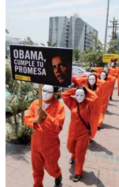
Activistas de Amnistía Internacional se manifiestan frente a la embajada de Estados Unidos en Lima.

ITALIA. Italia debe revisar las políticas que contribuyen a la explotación de los trabajadores migrantes y a la violación de su derecho a trabajar en condiciones justas y tener acceso a la justicia. Procedentes en su mayoría del África subsahariana, el Norte de África y Asia, realizan trabajos no cualificados, a menudo temporales o de temporada y principalmente en el sector agrícola en el sur del país.