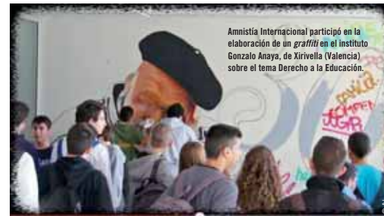
Amnistía Internacional participó en la elaboración de un graffiti en el instituto Gonzalo Anaya, de Xirivella (Valencia) sobre el tema Derecho a la Educación .