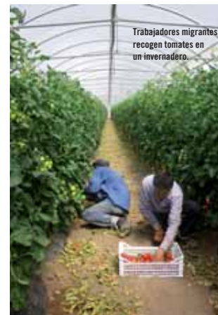
Trabajadores migrantes recogen tomates en un invernadero.

Sr. Wert, queremos derechos humanos en la educación www.actuaconamnistia.org