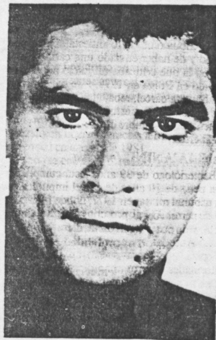
Vasil Stus, de la URSS. Condenado a 15 años de cárcel y exilio interno por sus actividades como "vigilante" de Helsinki. Recluido en una colonia de trabajo correccional de régimen especial. □

Destacado periodista de 64 años. Ha permanecido detenido desde 1970, acusado de sedición. Juzgado por un tribunal militar, fue sentenciado a cadena perpetua, pena que luego se conmutó por 15 años de cárcel. La acusación se refería a actividades anteriores a 1949, creyéndose que el motivo real de su encarcelamiento han sido los artículos que ocasionalmente escribía criticando al gobierno. □