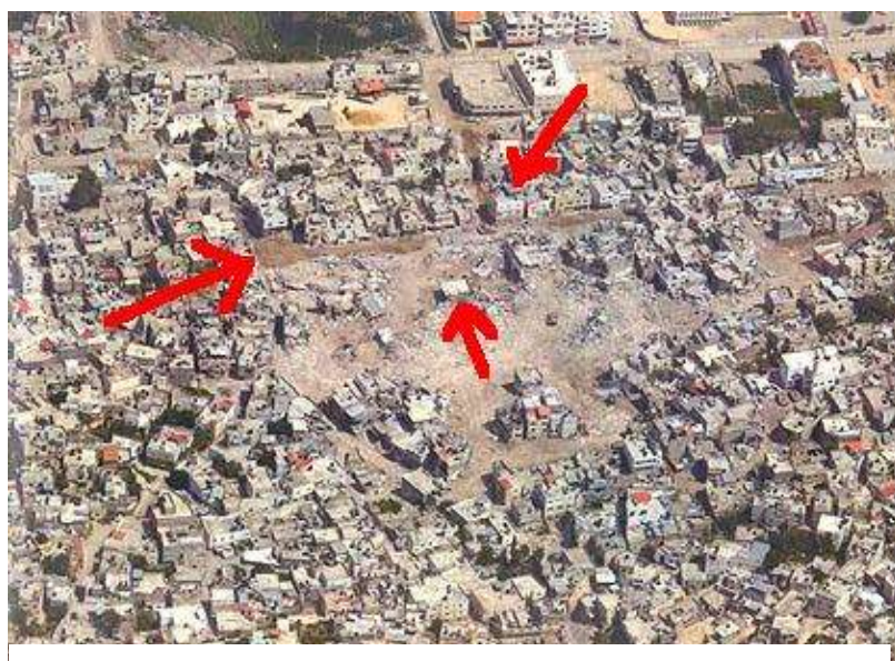
Campo de refugiados de Yenín, 13 de abril de 2002

Las fechas trazadas sobre estas fotografías aéreas del campo de refugiados de Yenín muestran la superficie del barrio de Hawashin que fue demolida entre el 11 y el 13 de abril de 2002, cuando, según informes, habían acabado ya los combates.