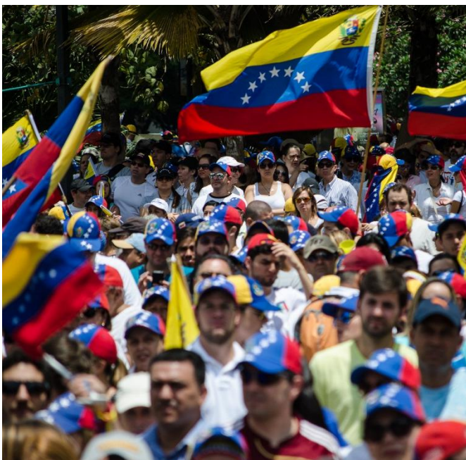
Abajo derecha: Marcha en apoyo al gobierno, 22 marzo 2014