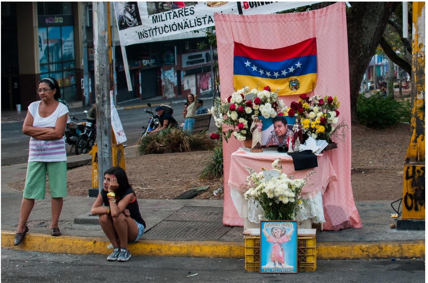
Arriba: Altar en memoria a Daniel Tinoco, estado Táchira, marzo 2014