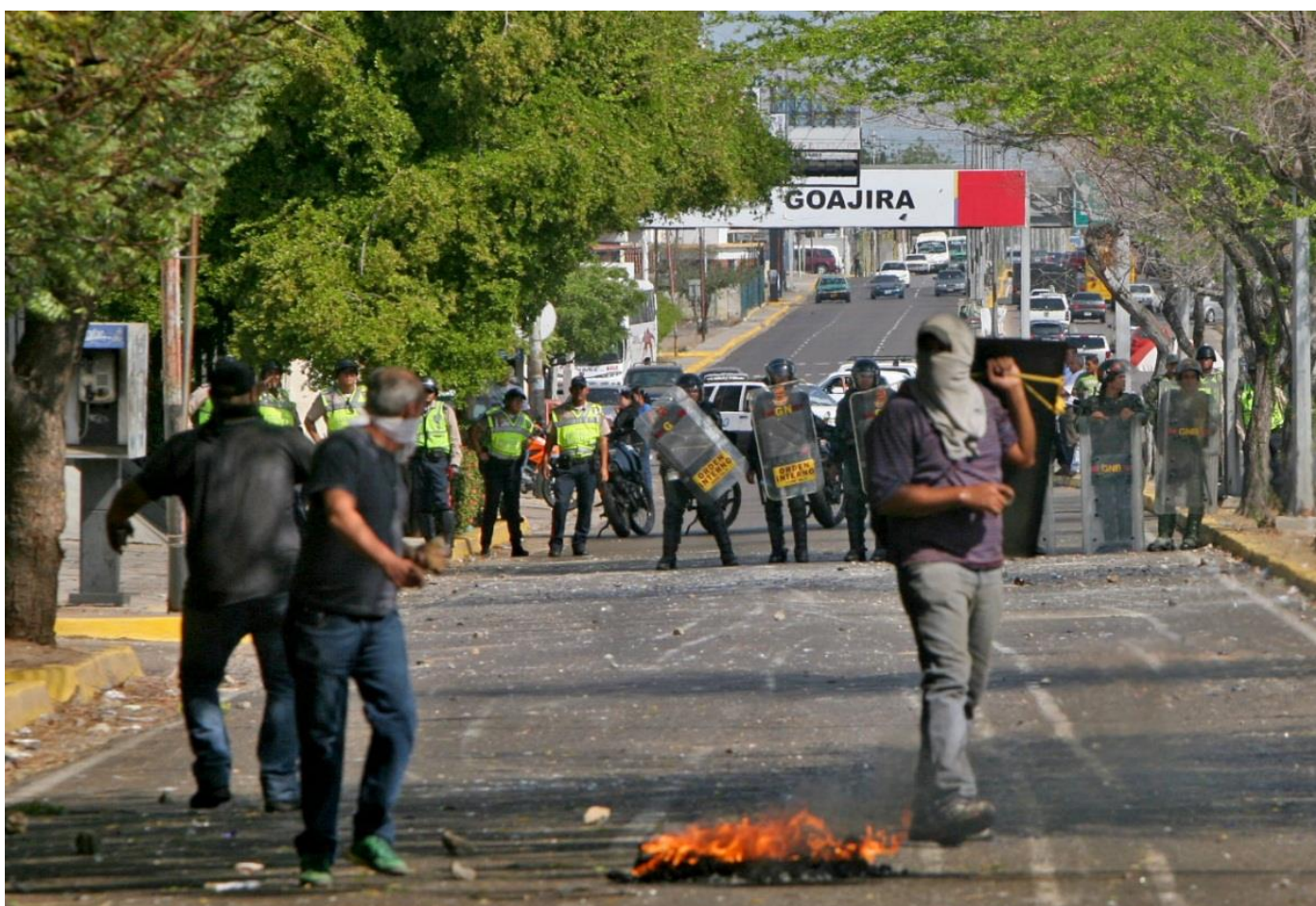
Abajo: Protestas en Estado Zulia, marzo 2014