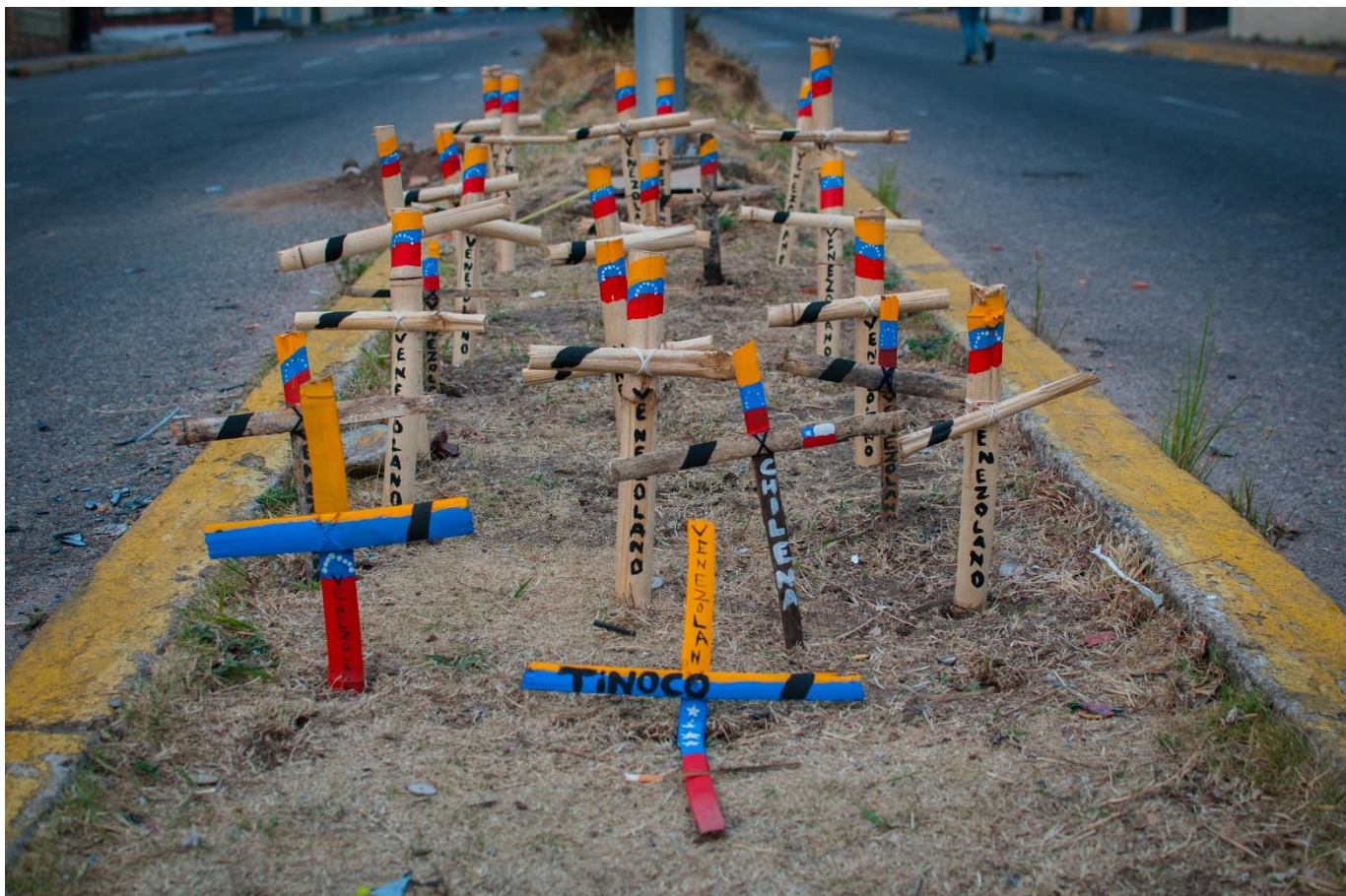
Arriba: una serie de cruces representan las personas que han muerto a un mes del inicio de las protestas, estado Táchira, marzo 2014