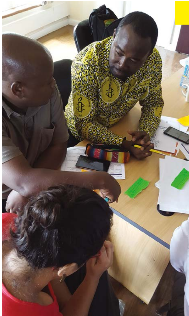
Imagen de portada: Formación para impedir el acoso escolar.

Quando los derechos humanos llegan a la clase, al patio de recreo y al corazón y la mente de la gente joven, las actitudes y las conductas comienzan a cambiar.