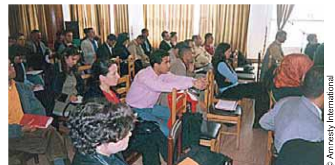
Dans le cadre de sa campagne Halte à la violence contre les femmes, Amnesty International a animé en Algérie un débat sur la place des femmes dans le droit en Afrique du Nord.

Pour en savoir plus, reportez-vous à la communication adressée par Amnesty International au Comité des droits de l'homme, consultable sur http://www.amnesty.org/fr/library/info/MDE28/017/2007 .