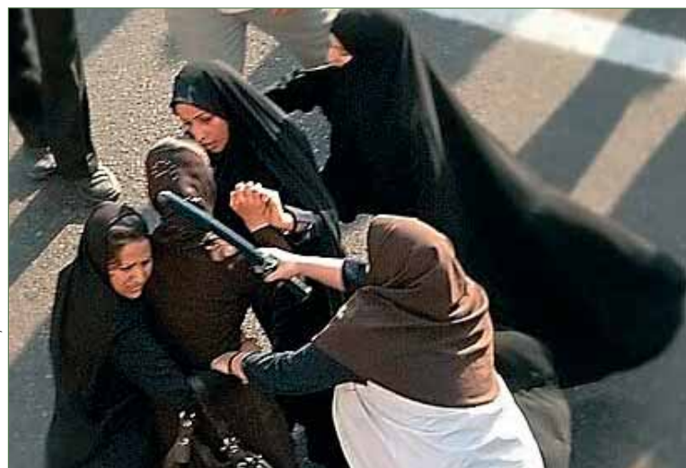
Des policières rouent de coups des personnes participant à une manifestation pacifique (Téhéran, juin 2006).

Pour agir, reportez-vous aux Appels mondiaux de ce mois.