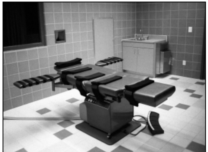
Камера для приведения в исполнение смертных приговоров в тюрьме г. Терре Хот (Terre Haute), штат Индиана, США. Устройство для введения смертельной инъекции.

Amnesty International призывает власти в регионе передать огласке данные о применении смертной казни и проследить, чтобы родным казнённых предоставляли полную информацию о казни, в том числе о дате и месте приведения приговора в исполнение и о месте их захоронения. Кроме того, родственникам следует выдавать тело казнённого и его личные вещи.