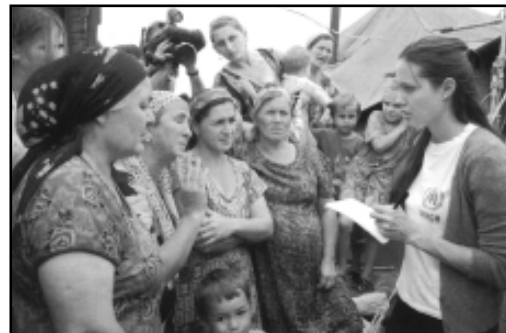
На фото: Анжелина Джоли во время поездки на Северный Кавказ.

Совет лидеров деловых кругов, созданный по инициативе бывшего Верховного комиссара ООН по делам беженцев Рууда Любберса, состоит из высокопоставленных сотрудников пяти крупнейших корпораций, которые вместе с УВКБ ООН работают в сфере предоставления более широких возможностей для беженцев: «Мерк и Со.», «Майкрософт», «Нестле», «Найк» и «Прайсуотерхаус Купер». Помогая, в частности, девушкам-беженцам получить доступ к образованию и информационным технологиям.