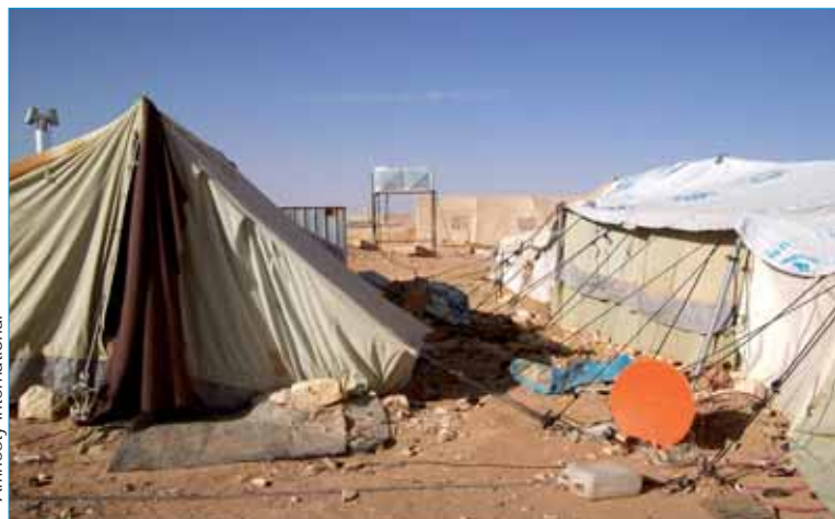
Le camp d'Al Tanf, dans le no man's land de la frontière irako-syrienne (mars 2008).

► Suffering in silence: Iraqi refugees in Syria (MDE 14/010/2008)