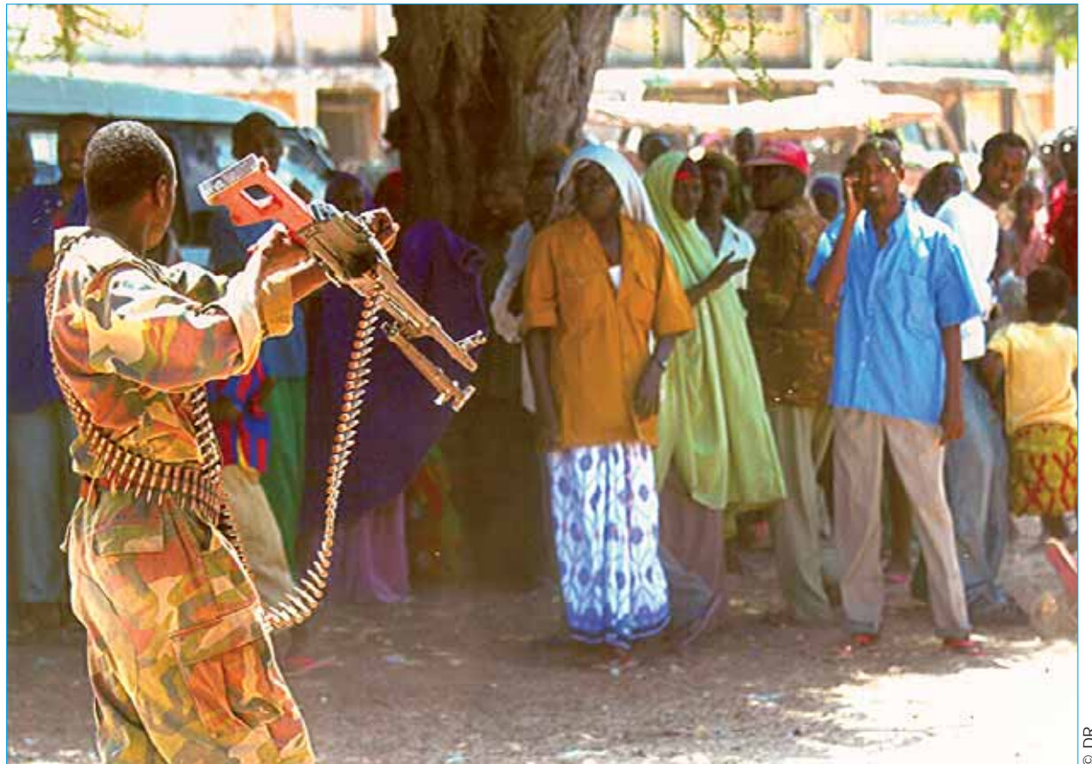
Un soldat des forces gouvernementales chargé de surveiller des stocks de nourriture menace des civils (Mogadiscio, mai 2007).