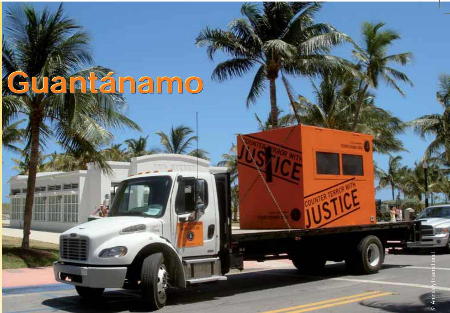
La réplique d'une cellule de haute sécurité de Guantánamo, en route pour son périple à travers les États-Unis.

Les États-Unis refusent de se conformer aux définitions internationales de la torture et des mauvais traitements, utilisent de manière persistante la détention illimitée sans inculpation, continuent de nier le droit des détenus de contester devant les tribunaux la légalité de leur détention et mènent un programme de « restitutions » et de détentions secrètes mis en œuvre par l'Agence centrale du renseignement (CIA).