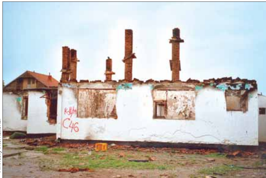
Des maisons appartenant à des Ashkalis incendiées à Vucitrn/Vusshtri (Kosovo). Amnesty International demande que les réfugiés ne soient plus contraints à rentrer de force au Kosovo.

Des municipalités kosovares majoritairement peuplées de Serbes viennent d'organiser des élections locales et législatives pour désigner leurs représentants au Parlement serbe. Ces scrutins, qui n'ont été reconnus ni par les autorités de Pristina ni par la MINUK, ont contribué à jeter un peu plus d'huile sur le feu.