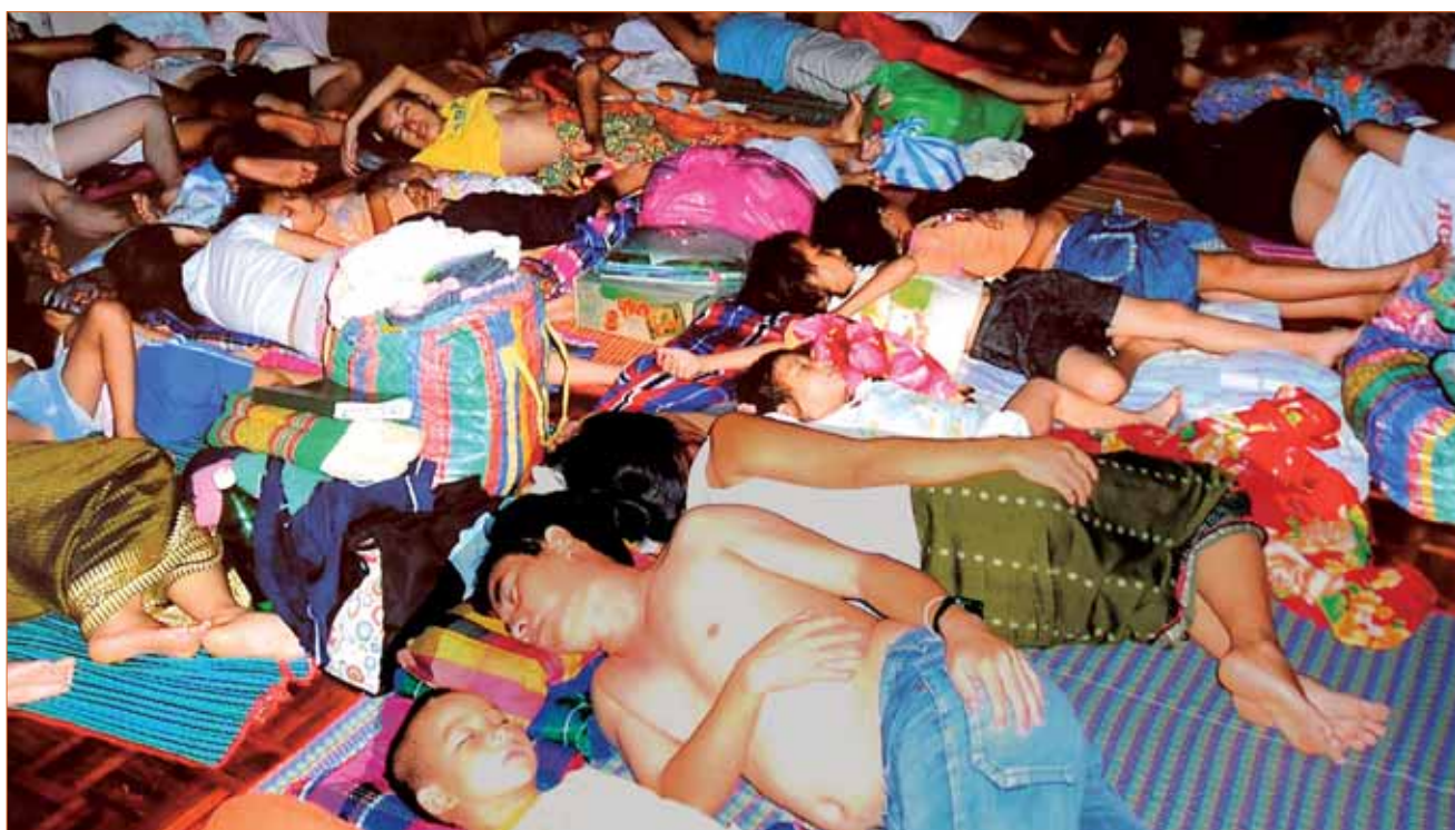
Des réfugiés hmongs laotiens dans des cellules surpeuplées et dépourvues de fenêtre du centre de détention pour immigrés de Nong Khai, dans le nord de la Thaïlande.

Plus de 370 demandeurs d'asile hmongs laotiens ont été renvoyés de force par la Thaïlande depuis décembre 2005. À leur retour au