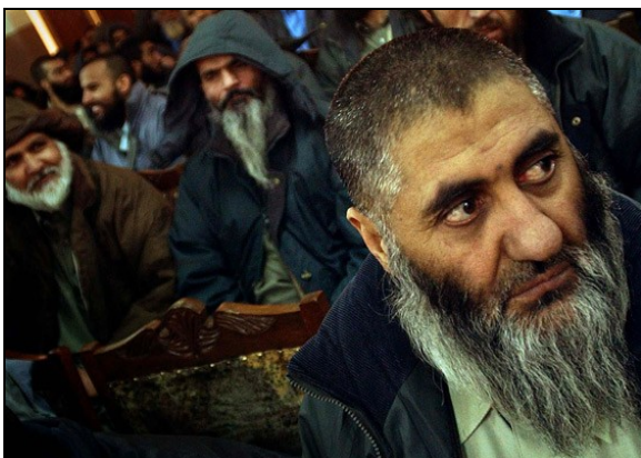
Prisonniers afghans arrivant de la base américaine de Bagram, à Kaboul (Afghanistan), et comparaisant devant la Cour suprême des États-Unis en 2005.