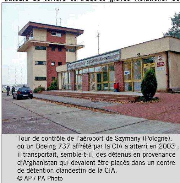
Tour de contrôle de l'aéroport de Szymany (Pologne), où un Boeing 737 affrété par la CIA a atterri en 2003 ; il transportait, semble-t-il, des détenus en provenance d'Afghanistan qui devaient être placés dans un centre de détention clandestin de la CIA.

Malheureusement, les seuls engagements fermes pris au cours des premiers jours du nouveau gouvernement sur la question de l'obligation de rendre des comptes pour les atteintes passées aux droits humains ont eu pour effet de consacrer l'impunité de certains auteurs de torture et d'autres graves violations. Cette situation est incompatible avec les obligations internationales qui incombent aux États-Unis.