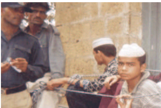
Au Pakistan, des mineurs délinquants présumés attendent d'être jugés.

Amnesty International a recensé deux exécutions de mineurs délinquants au Pakistan dans les années 90 – en 1992 et 1997.