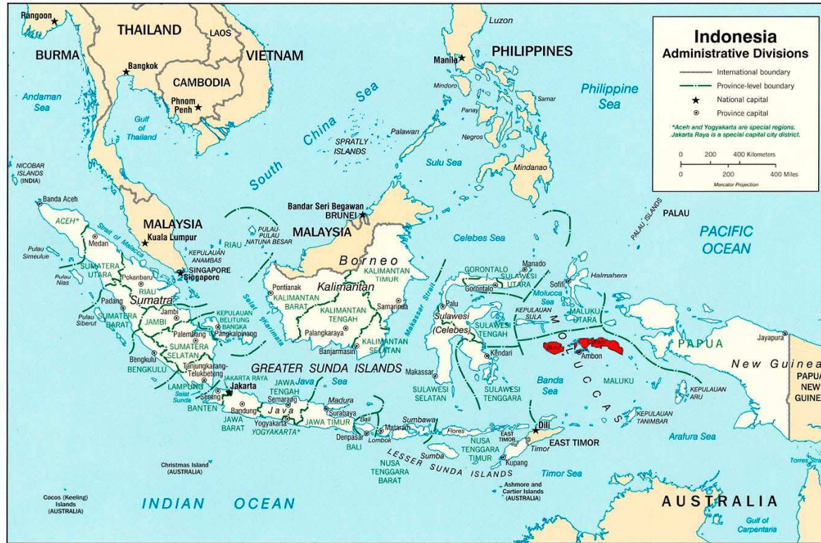
Base 802900AI (C00429) 11-02