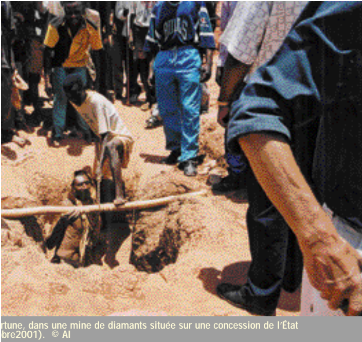
fortune, dans une mine de diamants située sur une concession de l'État (mars 2001).

partie intégrante du cadre de protection des travailleurs et permettent l'instauration d'un