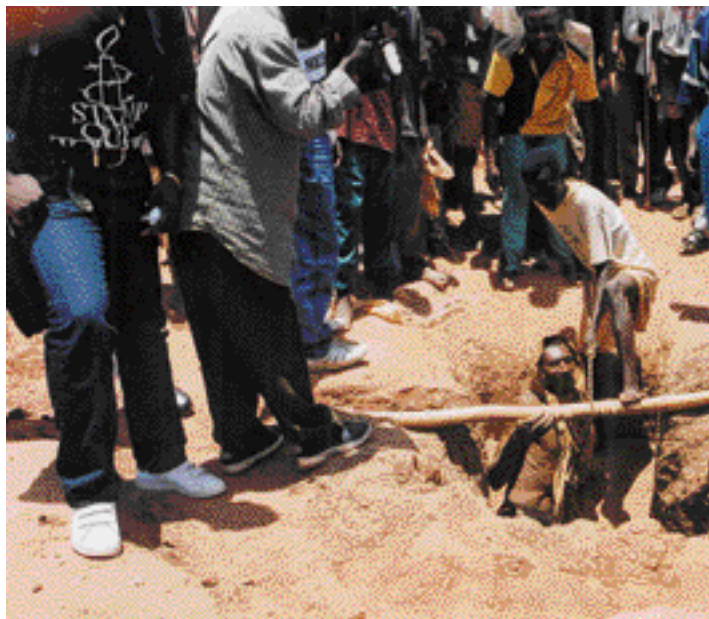
Ouvrier clandestin sortant d'un puits de fortune, dans une mine de diamants situ (République démocratique du Congo, octobre 2001).

Les femmes qui partent travailler en Arabie saoudite, notamment lorsqu'elles sont originaires de pays pauvres du Moyen-Orient, d'Afrique ou d'Asie, sont fréquemment victimes d'abus de la part de leurs employeurs, dont elles dépendent totalement. Beaucoup ne sont pas payées, et certaines sont battues ou violées. Amnesty International dénonce cette discrimination systématique et l'incapacité du système pénal saoudien à protéger ces femmes.