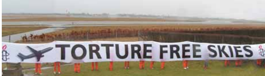
Action pour un ciel sans torture organisée par Amnesty International au Danemark